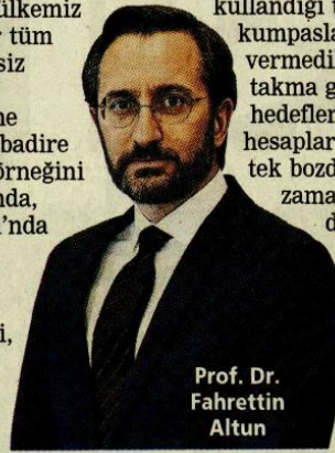
Prof. Dr. Fahrettin Altun

15 Temmuz darbe girişimine karşı milletimizin ortaya koyduğu onurlu mücadeleyi ve şehitlerimizi hiçbir zaman unutmayacağız, unutturmayacağız. 15 Temmuz zaferimiz, Demokrasi ve Milli Birlik Günümüz kutlu olsun.